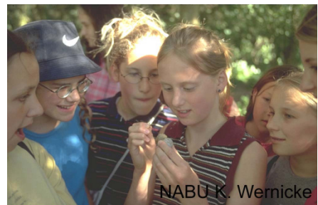
Kinder entdecken die Natur

Der öffentlich zugängliche Gottlieber Weg führt durch den Osten des Wollmatinger Rieds bis zum Seerhein und ist kinderwagengerecht (wassergebundene Decke). Am Seerhein gegenüber dem schweizerischen Dorf Gottlieben befindet sich eine Bank mit schöner Aussicht. Für das Wollmatinger Ried ist ein beschilderter Naturlehrpfad in Planung, der einen Besuch im Naturschutzgebiet noch attraktiver gestalten soll.