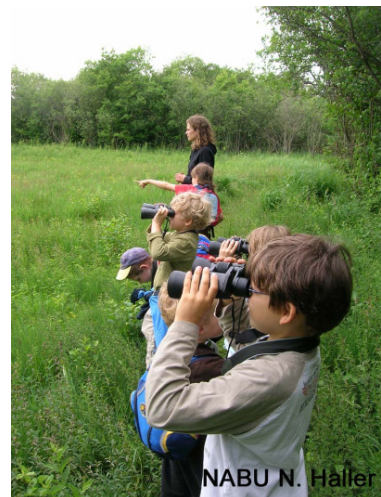
Kinderführung im Ried

Familien mit Kindern ab dem Kindergartenalter können an den öffentlichen Riedführungen teilnehmen. Für kleinere Kinder sind die öffentlichen Riedführungen nur wenig geeignet. Der Führungsweg ist nicht frei zugänglich. Mit dem Kinderwagen ist der Führungsweg nicht befahrbar. Die großen Riedführungen gehen über eine 5 km lange Strecke und dauern drei Stunden; die kleinen Riedführungen bzw. Riedspaziergänge betragen eine Strecke von 3 km und dauern zwei Stunden. Es ist keine Abkürzung möglich. Ausgangspunkt für die öffentlichen Riedführungen ist das alte Naturschutzzentrum Vogelhäusle .